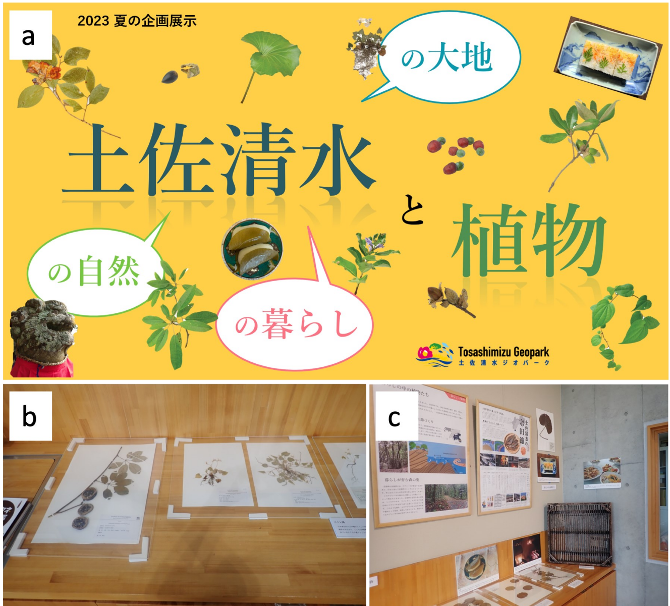
図5 植物相調査の成果を活用した企画展示の様子 (a: 広報用バナー, b, c: 展示室の様子) Figure 5. Exhibition with the results of flora survey (a: PR banner, b, c: photo of the exhibition)

その後生育が確認されていなかった。しかし、この調査によって、2022年9月、大岐地区の海岸から約100 m離れた山際の路傍でイワダレソウの自生が確認された(細川, 2023)。