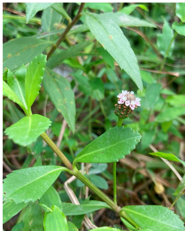
図4 23年ぶりに高知県内で再発見されたイワダレソウ Figure 4. Phyla nodiflora was rediscovered in Kochi Prefecture for the first time in 23 years

この調査によって，高知県内で23年ぶりに自生のイワダレソウ（ Phyla nodiflora ）が確認された（図4）。イワダレソウはクマツヅラ科の多年草で，日当たりのよい海岸に生育し，世界に広く分布する（遠藤，2021）。高知県では生育地が孤立していることによって絶滅の危機に瀕しており，1999年の土佐清水市大岐地区での記録を最後に，