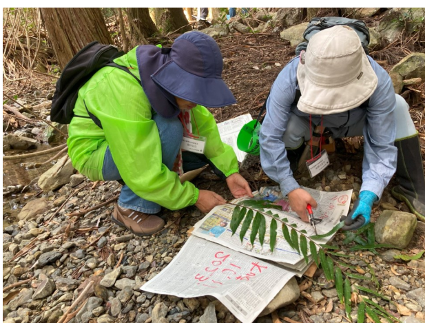
図3 土佐清水ジオパークエリアでの植物相調査の様子 Figure 3. Photo of the flora survey in Tosashimizu Geopark area.

この調査は，牧野植物園，高知県民による植物調査ボランティア，そして土佐清水ジオパーク推進協議会が協力して行った（図3）。